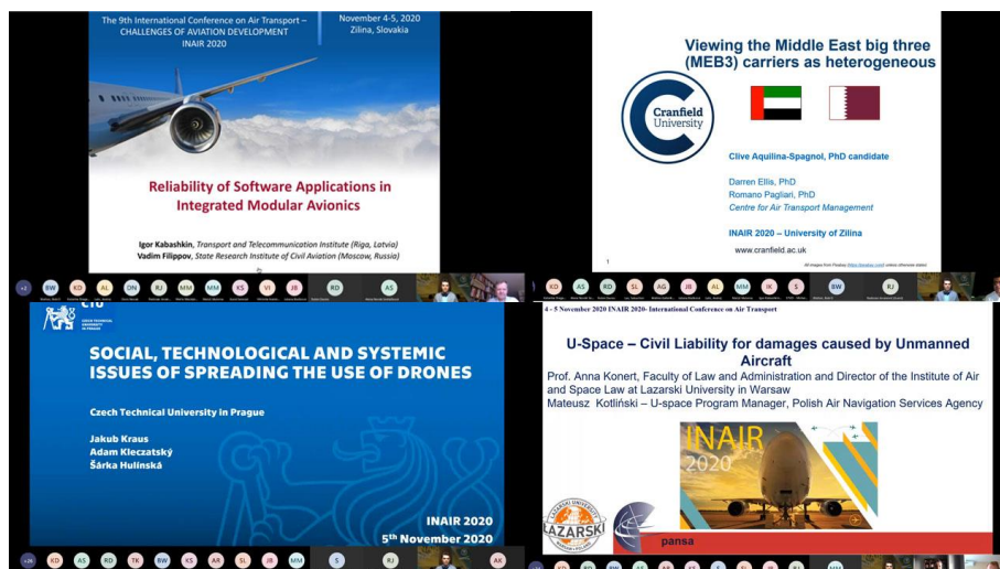
Obrázok 3: Vybrané príspevky účastníkov konferencie INAIR 2020

Matija BRAČIĆ (Obr. 2 - dolný rad vpravo) z Univerzity Záhreb analyzoval odporúčané opatrenia v súvislosti s COVID-19 pri zabezpečovaní plynulosti pohybu cestujúcich v termináloch letísk v Chorvátsku.