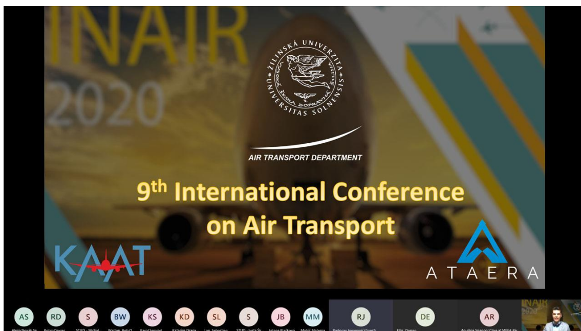
Obrázok 1: Medzinárodná konferencia INAIR 2020 – zorganizovaná v rámci projektu Knowledge Alliance in Air Transport (KAAT) a v spolupráci s Air Transport and Aeronautics Education and Research Association (ATAERA)

V dňoch 4. a 5. novembra 2020 bolo našou úlohou, aby každý zo 40 prednášajúcich odprezentoval svoj príspevok bez akýchkoľvek problémov. Zriadili sme virtuálne konferenčné štúdio a začali.